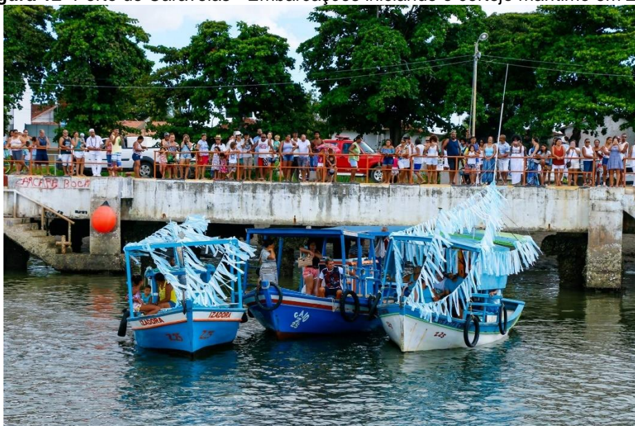
Figura 12- Porto de Caravelas - Embarcações iniciando o cortejo marítimo em 2019