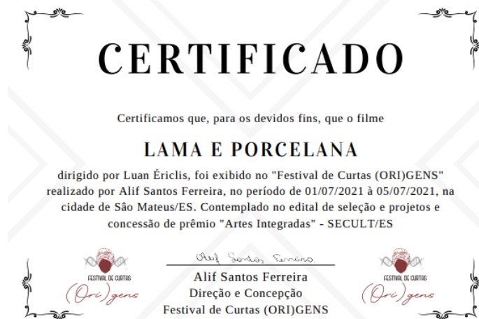
Figura 17- Certificado de participação no festival de exibição de curta ORIgens

O mecanismo contribui anualmente para que milhares de projetos culturais aconteçam em todas as regiões do país. Nesse caso, a minha obra “Lama e Porcelana” destaca-se como uma homenagem aos parceiros e informantes-chave dessa pesquisa, em especial pelo presente de vivenciar uma realidade tão poética e cheia de desafios ao passo que valoriza os conhecimentos tradicionais locais e resgate à nossa ancestralidade afro-brasileira centrada na transmissão oral de saberes que transcendem o espaço-tempo.