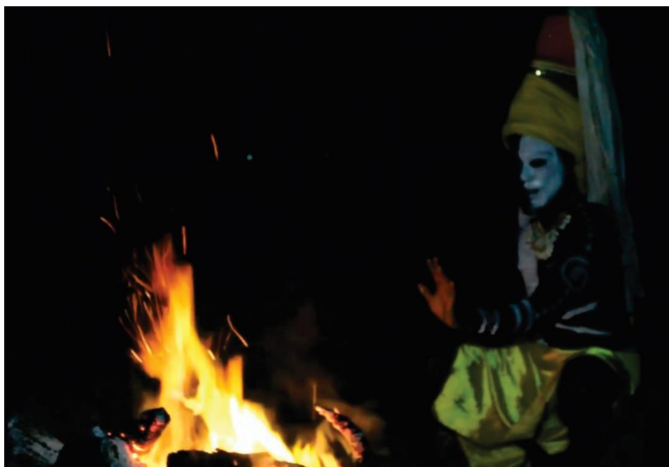
Figura 16- Cena em que o Griô desenvolve a contação da história como narrador personagem

No último ato, acompanhamos a realização desses desejos e é quando a cabocla se torna uma árvore, uma Siriba do mangue, e nos é revelado a mensagem principal do filme. O enredo apresentado como contação de história, na figura do personagem griô, traz reflexões acerca da ancestralidade, da relação com a natureza, do pertencimento e do nosso lugar no mundo. Na perspectiva de olhar para o passado e seus ensinamentos e assim construir novas possibilidades de futuro.