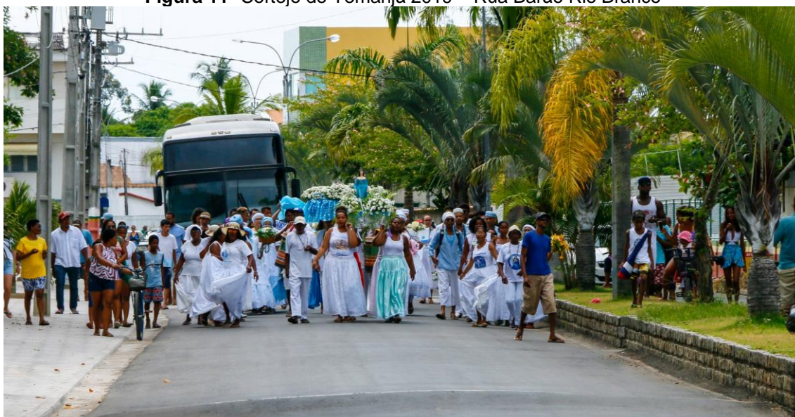
Figura 11- Cortejo de Yemanjá 2019 – Rua Barão Rio Branco

A festança dedicada a rainha dos mares, acontece anualmente todo dia 02 de fevereiro desde os anos 2000, o cortejo passa pela rua Barão do Rio Branco, praça de Santo Antônio no centro histórico e toma a rua 7 de setembro, a principal da cidade, em direção ao porto (figura 11), e segue navegando pelo rio caravelas até chegar à praia de Yemanjá, localizada a 20 km da sede do município (figura 12).