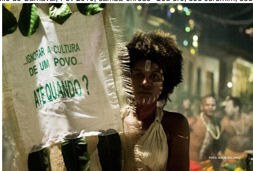
Figura 18- Desfile de Carnaval, Fev 2019, samba-enredo “Sou erê, sou curumim, sou criança”

e produziu importantes contribuições que devem ser defendidos em tempos de negacionismo, porém tais conhecimentos segmentados dificultam a compreensão de um organismo terra em sua totalidade. Novamente, as reflexões de Seu Pedrinho remetem ao pensamento de Krenak (2019), ao destacar que o a comunidade, o caranguejo, a mata e o rio são todos integrantes do mesmo organismo e sabidamente equilibrados, a terra nos provê a vida se soubermos respeitar o seu equilíbrio natural.