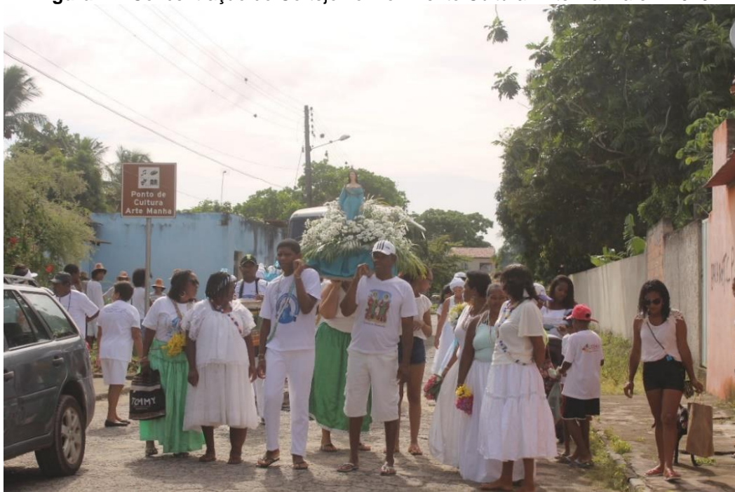
Figura 14- Concentração do Cortejo no Movimento Cultural Arte Manha em 2019