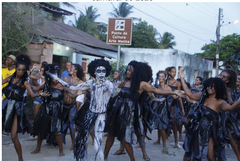
Figura 5- Sede do movimento cultural ArteManha e Grupo Umbandaum na avenida no carnaval de 2020

Esse termo “Afroindígena” surge como um conceito identitário-artístico-visual pela primeira vez em Caravelas na década de 80 com o grupo Afroindígena de Antropologia Cultural Umbandaum fundado no dia 13 de maio de 1988, como “resistência aos grupos políticos locais que induziam a população caravelense em comemorações dos 100 anos de abolição da escravatura” (SILVA, 2019, p. 5). O Umbandaum é um grupo organizado que está vinculado ao Movimento Cultural ArteManha, que recebeu o título de ponto de cultura em 2008.