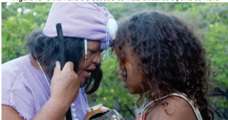
Figura 15- Orixá Nanã e a Cabocla da mata entoando o ponto de Nanã