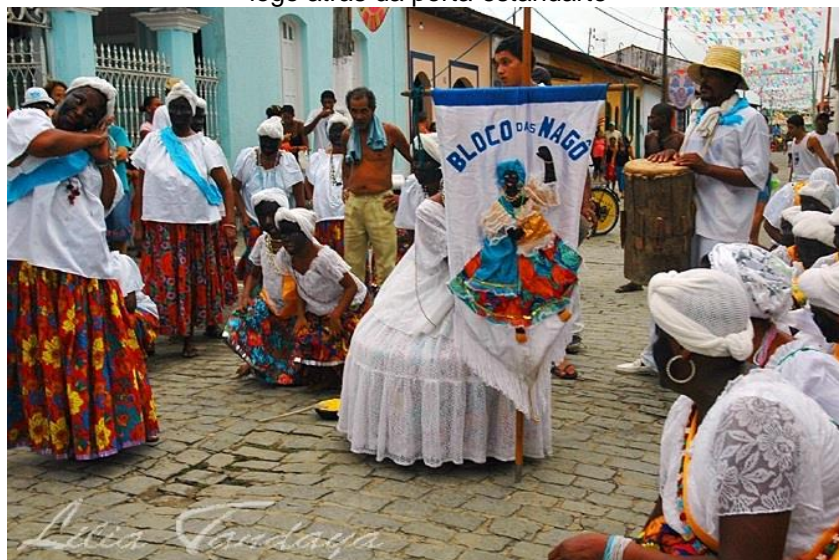
Figura 9- Bloco das Nagô na Avenida - Destaque para a pintura facial e para a tigela de farinha logo atrás da porta-estandarte

religião espírita e esse nunca foi um critério para ser nagô ou ser tupinambá . Destaco também dois elementos que reforçam a “contracultura” (SILVA, 2019, p. 217) definida por Itamar do Grupo Umbandaum: Em tupinambás, a identidade indígena levantada pelo grupo transcende as fantasias vãs e pejorativas de carnaval, celebra o DNA indígena que corre nas veias e caminha na contramão da apropriação cultural, existe uma busca pela reverência aos “antigos”, aos nativos, a quem pisou na mata primeiro.