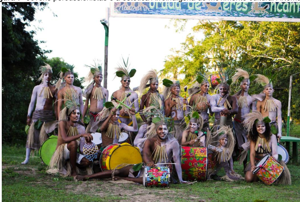
Figura 7- Jovens percussionistas e a estética Afroindígena do movimento cultural Artemanha

Afroindígena pode apontar para uma relação virtual entre negros africanos e indígenas sul-americanos, antes mesmo da conquista europeia, relação em que se fundem em significados cronológicos e mitológicos. Assim, a relação prévia e histórica entre negros e índios interpreta a semelhança estrutural entre corpos negros e indígenas de hoje, aproximados pela força motriz da resistência para se opor às opressões forçadas pela hegemonia branca. Como eles afirmam: “afroindígenas são os grupos historicamente discriminados e excluídos” (MELLO, 2017, p. 4).