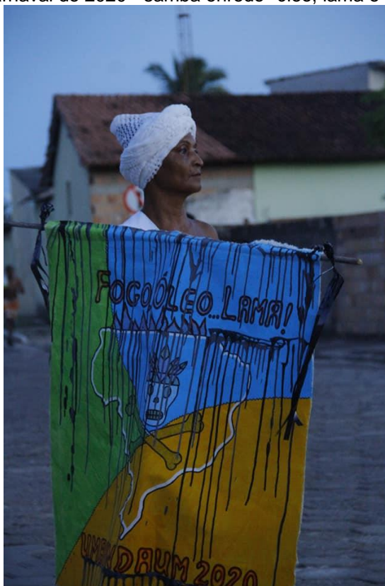
Figura 6-Carnaval de 2020 - samba enredo "óleo, lama e fogo"

Na figura 04 e 05 destacam-se nas expressões visuais de corpo e movimento, uma crítica ao maior crime ambiental no nordeste brasileiro, o derramamento de petróleo cru em suas praias e manguezais. O clamor por justiça é expressado nos movimentos corporais da dança Afroindígena, inspirados em orixás africanos, encantados indígenas e movimentos de repetição da labuta – como puxar a rede e carregar o balaio . A porta bandeira é referência na cidade quando o assunto é acarajé, e em suas mãos escorrem o samba enredo de 2020 “Fogo, óleo e Lama”.