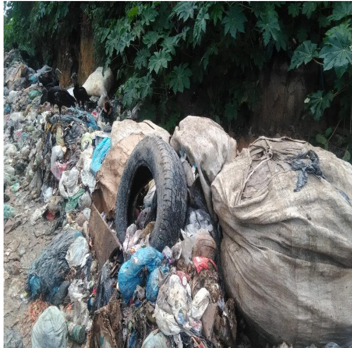
FIGURA 4. Local de destinação final dos resíduos, Porto Seguro, 2019 – Imagem 2