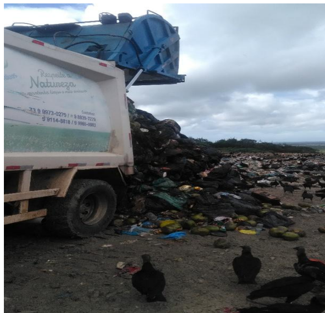
FIGURA 5. Local de destinação final dos resíduos, Porto Seguro, 2019 – Imagem 3