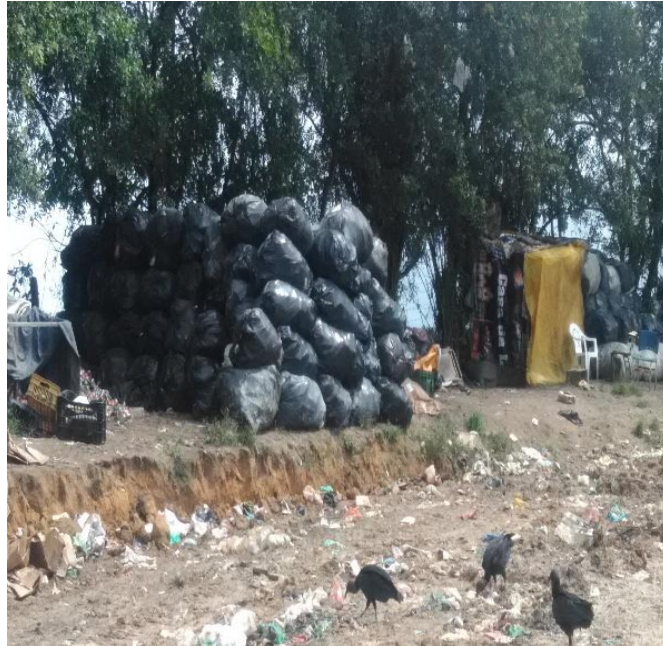
FIGURA 6. Local de destinação final dos resíduos, Porto Seguro, 2019 – Imagem 4