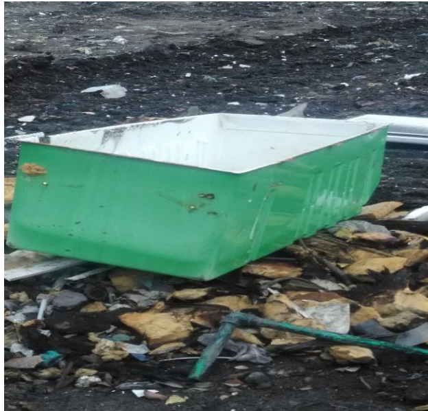
FIGURA 9. Local de destinação final de entulhos e podas de Arraial d’Ajuda – Distrito de Porto Seguro, 2019 – Imagem 3