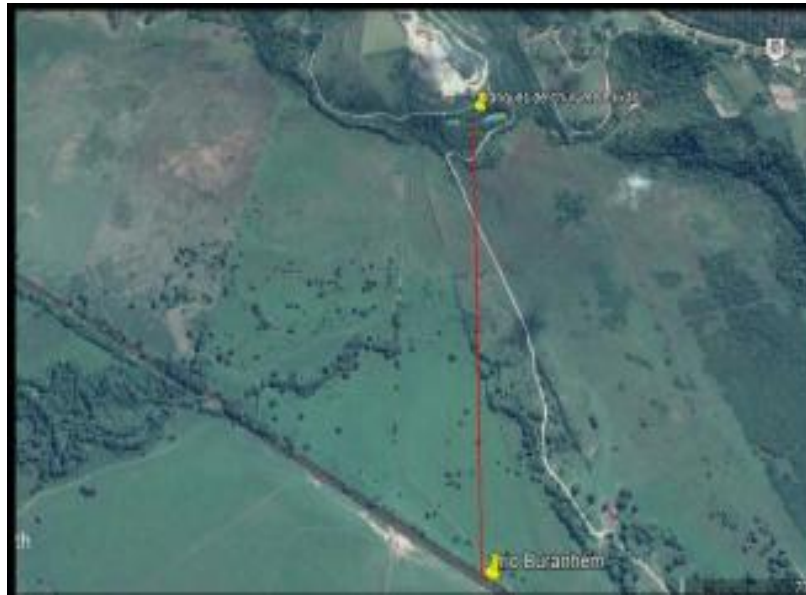
FIGURA 2. Mapa do local de destinação final dos resíduos, Porto Seguro, 2019

Nesse sentido , além de ferir a legislação vigente, o local é considerado uma APP (Área de Preservação Permanente), sendo uma encosta próxima à nascentes e leito de um rio.