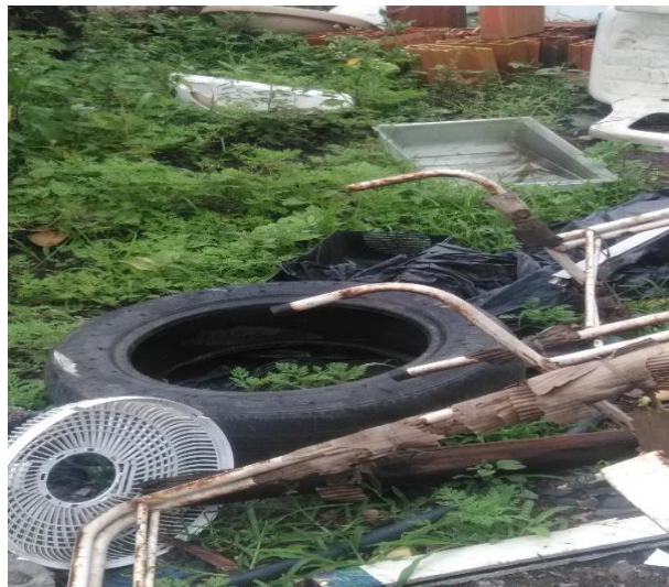
FIGURA 8. Local de destinação final de entulhos e podas de Arraial d’Ajuda – Distrito de Porto Seguro, 2019 – Imagem 2