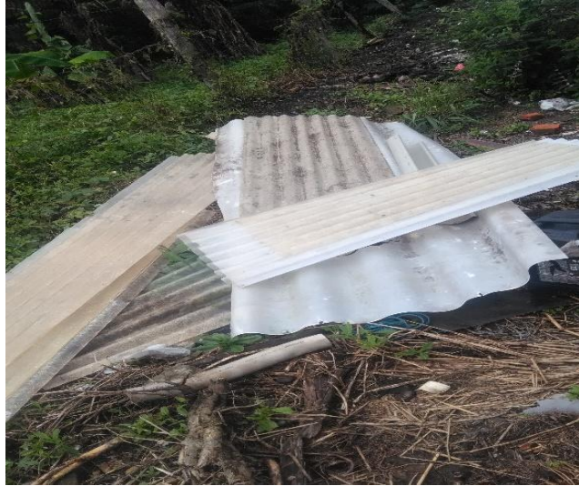
FIGURA 7. Local de destinação final de entulhos e podas de Arraial d’Ajuda – Distrito de Porto Seguro, 2019 – Imagem 1