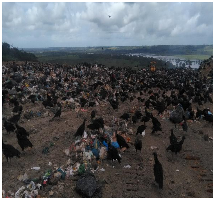
FIGURA 3. Local de destinação final dos resíduos, Porto Seguro, 2019 - Imagem 1

Em visita realizada em 12 de agosto de 2019 ao principal lixão do município, foram confirmadas irregularidades no processo de gerenciamento dos RSU, corroborando com as identificadas pelo relatório do CONDESC. Através das figuras a seguir, é possível observar que, na prática, em Porto Seguro não se aplica as recomendações relacionadas a coleta seletiva, tratamento e destinação final adequada dos resíduos, conforme determinação da PNRS e PNMA.