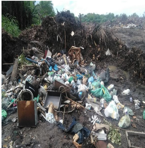
FIGURA 10. Local de destinação final de entulhos e podas de Arraial d’Ajuda – Distrito de Porto Seguro, 2019 – Imagem 4